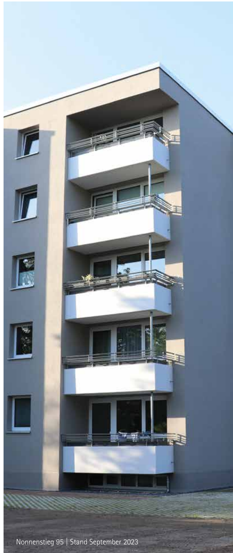
Nonnenstieg 95 | Stand September 2023

Aber sicher! Wir Mieter hätten uns gewünscht, bei manchen Entscheidungen wie z. B. Hausfarbe oder Bepflanzungen mit einbezogen zu werden. Gern hätten wir auch eine Sitzgelegen-