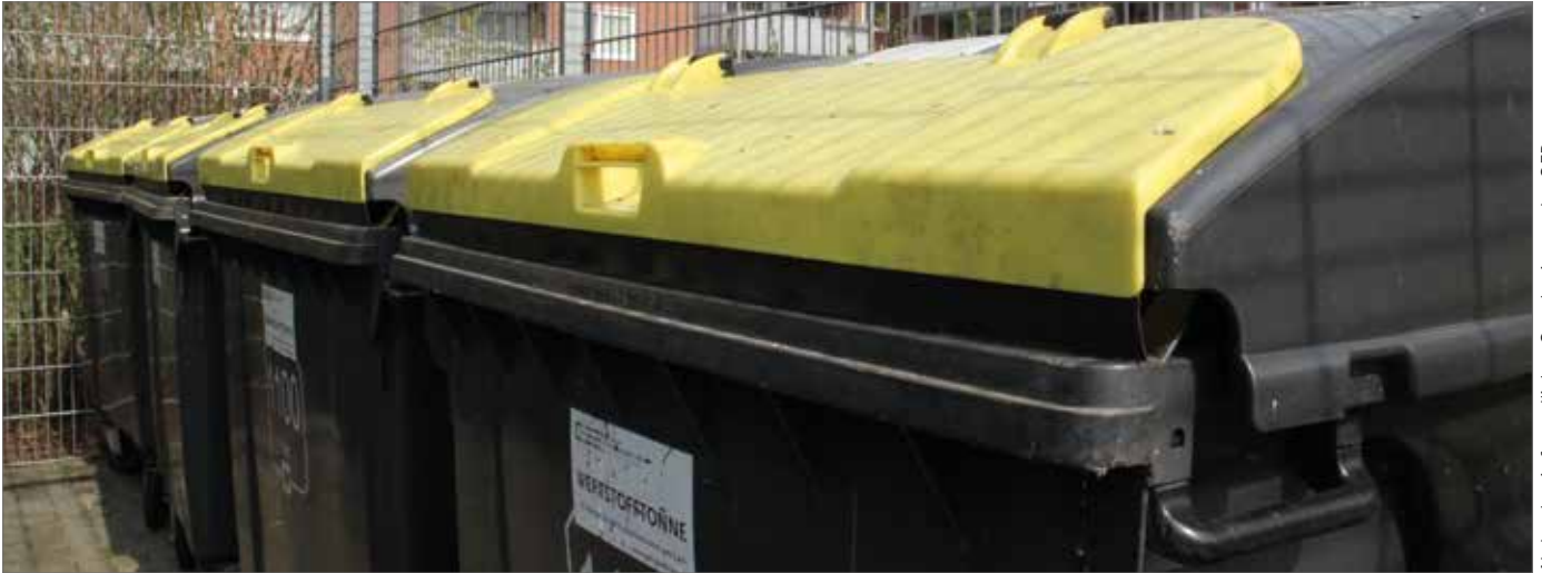
Abdruck mit freundlicher Genehmigung der GEB

Ab dem 01.01.2024 wird in der Stadt Göttingen der gelbe Sack durch eine Wertstofftonne abgelöst. Im Innenstadtbereich (innerhalb des Walls) werden geeignete Wertstoffsäcke verteilt, da häufig kein weiterer Behälterstellplatz auf den Grundstücken zur Verfügung steht.